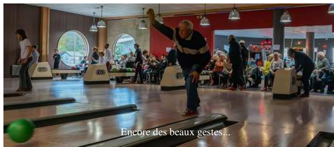
Encore des beaux gestes...