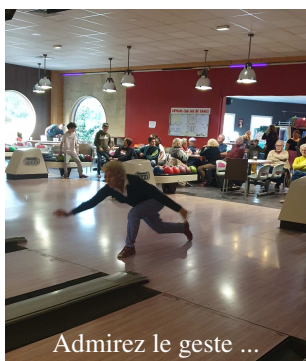
Admirez le geste ...