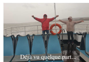
Déjà vu quelque part...