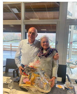
Les gagnants du panier garni

Vendredi nous voilà à Dieppe malgré une météo maussade, les visiteurs sont nombreux. Nous nous régalons de coquilles Saint-Jacques et de harengs.