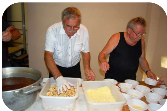
Et le soir, gruyère, croûtons