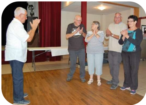
Apprenons le ban du CCC aux nouveaux adhérents