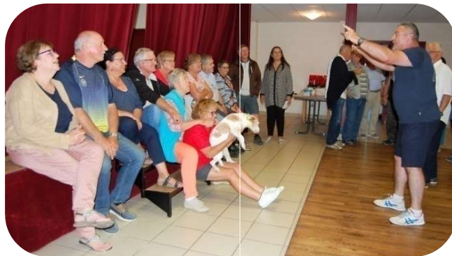
A quand la chorale au Club ?