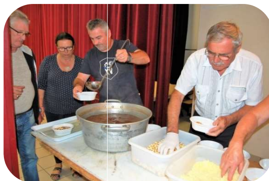
Et voilà la soupe à l'oignon